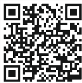
Vidéo mensurations homme